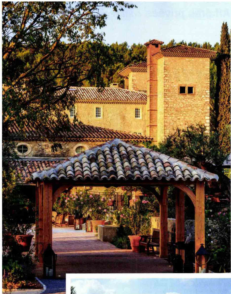
L'entrée. Mas ocre rose, terrasse aménagée sous le toit à la mode tropézienne et jardins fleuris ressuscitent l'atmosphère de la Provence.

27 chambres, dont 2 suites. A partir de 270 euros. Château de Berne , route de Salernes, Flayosç, 83510 Lorgues. A une vingtaine de minutes de la gare TGV des Arcs-Dragnignan. Tél : +33 (0)4-94-60-48-88. www.chateauberne.com