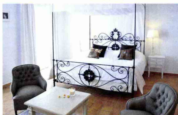
La chambre DeLuxe. Réparties dans deux bâtisses, les chambres ont toutes des tomettes de Salernes au sol et sont toutes prolongées d'un balcon.